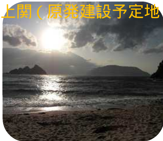
上関のきれいな海

私は山口県に住んで8年になりますが、上関のことはほとんど知りませんでした。行って見て、こんなにきれいなところなのか、と驚きました。上関の海はホットスポットと呼ばれていて生物多様性が保たれている貴重な海だそうです。国は上関への原発建設許可をまだ出していないそうです。しかし、山口県が埋め立を許可しているため埋め立て工事だけが進もうとしています。おかしな話です。山口県の中で話題にしていけないと、このきれいな海はいつのまにか失われてしまうかもしれません。また、行こうと思います。その時は、是非一緒に！